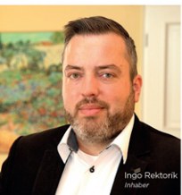
Ingó Rektorik Inhaber

The „Weimar“ meeting room is available for your meetings and events. For smaller events the Library is available, where you can pick up a good book - Goethe vor example?